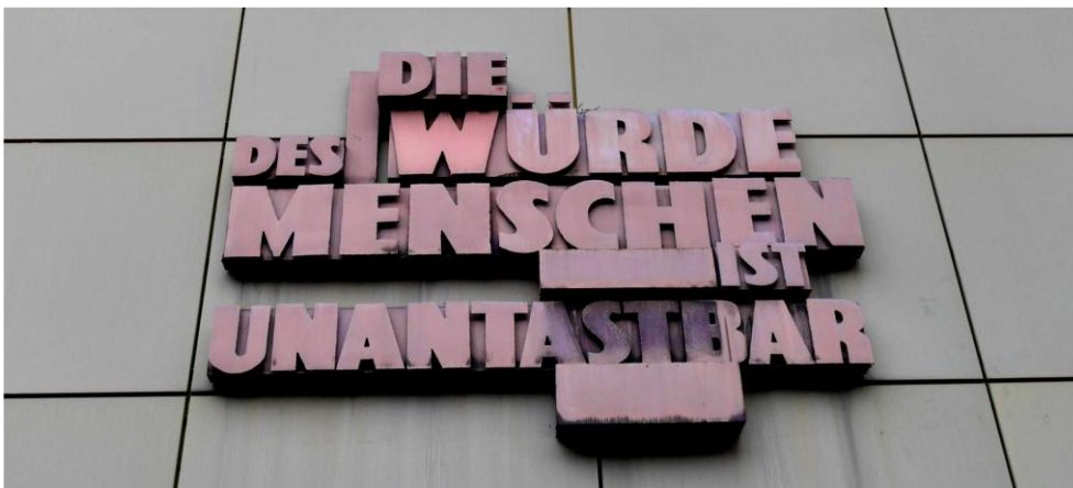
Fassade eines Gerichtsgebäudes in Frankfurt am Main